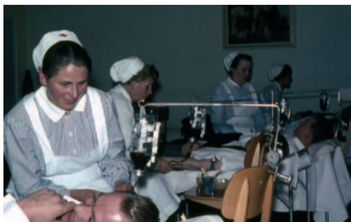
Blutspendeaktion Anno 1965