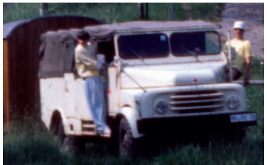
„Einsatzfahrzeuge“ damals ...

1992 stellte uns die Mercedes-Benz Niederlassung in Ravensburg aufgrund baulicher Umgestaltung ihre Ausbildungshalle zur Verfügung. Die aus Fertigelementen gebaute Baracke wurde von uns auf fachmännische Weise zerlegt und in Vogt zwischengelagert. Nach ein paar Anfragen und Verhandlungen mit der Gemeinde Vogt konnte uns diese dann unser jetziges Grundstück zur Verfügung stellen, wofür wir uns hier noch einmal recht herzlich bedanken möchten. Aufgrund der damaligen Situation stellte die Gemeinde allerdings die Bitte, das Gebäude für ca. 3 Jahre als Asylanten-Wohnheim zu nutzen. Nach einer Gesetzesänderung war dies dann aber nicht mehr notwendig. Es folgten mehrere Planungen und Überlegungen wobei schließlich beschlossen wurde, das Haus in Massivbauweise zu errichten und die Baracke anderweitig zu veräußern. Nach einer weiteren Planungsphase wurde dann am 21. November 1994 mit dem Bau des DRK-Heimes begonnen. Durch den tatkräftigen Einsatz vieler Helfer mit Eigenleistung konnte es schließlich am 03. August 1996 eingeweiht werden.