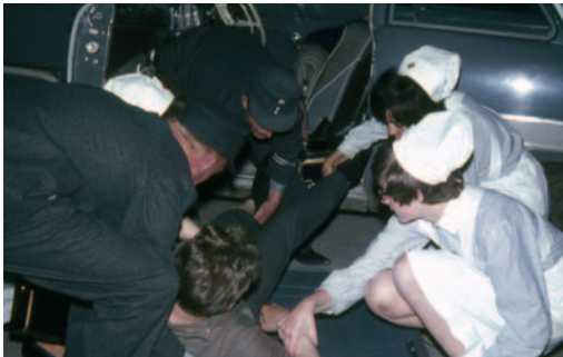
Sanitätsübung um 1965

Die Ausbildung in der Anfangszeit umfasste insbesondere das Erlernen diverser Verbände mit einer Binde oder dem sog. Dreieckstuch. Ein großer Vorteil der Dreieckstuch-Verbände bestand darin, dass Dreiecktücher quasi immer verfügbar waren, weil zu der damaligen Zeit sehr viele Frauen Kopftücher trugen. Auch das Schienen von Brüchen war ein wichtiger Bestandteil der Erste-Hilfe Ausbildung. Das Anlegen einer Schiene war mit erheblichem Aufwand verbunden – zunächst musste diese mit Binden umwickelt werden, bevor Sie zur Fixierung z.B. von Knochenbrüchen eingesetzt werden konnte.