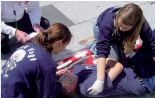
Erste Hilfe Aufgabe beim Wettbewerb

Der Bereich „Erste Hilfe“ ist für die JRK-ler der bedeutungsvollste Teil des Wettbewerbs, da sie schließlich stets dem Grundsatz, Leben zu retten, folgen.