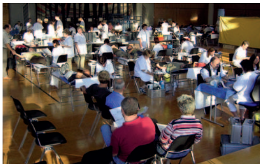
Blutspendeaktion in der Sirgenstein- halle