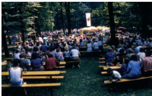
Grosser Andrang beim DRK Waldfest 1991

Anfänglich war das Fest auch am neuem Standort sehr erfolgreich, im Laufe der Zeit ließen allerdings die Besucherzahlen immer mehr nach. Dieser Trend hielt an, auch nachdem das Fest ab 1996 im neuen DRK-Heim gefeiert wurde. Nach dem letzten DRK-Fest im August 2000 wurde daher beschlossen, dieses einzustellen. Interessantes Detail: Bis 1982 wurden jedes Jahr ca. 1.000 Liter Bier ausgeschenkt, 1982 1.145 Liter; Ende der 80er Jahre ging der durchschnittliche Bierausschank auf ca. 450 Liter zurück.