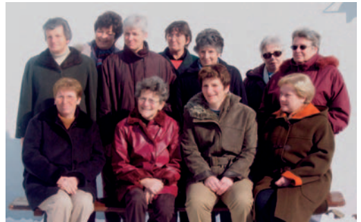
Arbeitskreis im Jahr 2006

Jedes Jahr am 5. Dezember besuchen 5-6 Teams, bestehend aus dem Bischof, dem Knecht Ruprecht und einem Fahrer, Kinder und Familien in Vogt und Umgebung. Die Spenden die dabei erzielt werden, erhält unser Arbeitskreis, um Geschenke zu basteln. Diese Geschenke werden meist zu Ostern und Weihnachten den Senioren in den umliegenden Seniorenheimen überreicht.