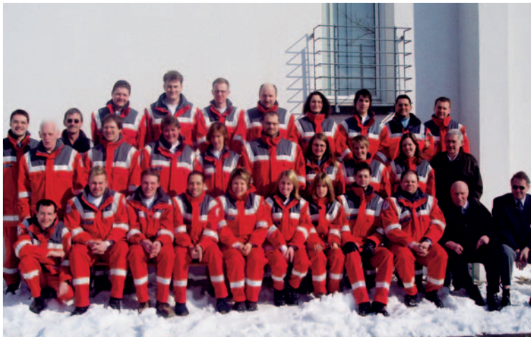
Bereitschaft DRK Vogt

Die DRK Bereitschaft Vogt besteht zurzeit aus insgesamt 43 DRK-Helfern und 3 Ärzten. Durch unser sehr aktives Jugendrotkreuz hat das DRK Vogt keinerlei Nachwuchssorgen. So können jedes Jahr ein paar Mitglieder vom JRK in die Bereitschaft aufgenommen werden. Das macht sich auch in der Altersverteilung bemerkbar: 31 Mitglieder, das sind 78% aller aktiven Helfer, sind im Alter zwischen 16 und 35 Jahren. Die Mitglieder der Bereitschaft Vogt sind sehr gut ausgebildet. Dies zeigt sich auch im guten Abschneiden der Vogter DRK-Gruppen bei diversen Wettbewerben. Zuletzt war dies ein hervorragender 3. Platz beim DRK-Landesentscheid 2003. 32 Helfer besitzen mindestens eine abgeschlossene Sanitätsdienst-Ausbildung (San-B). Diese Helfer dürfen als verantwortliche Personen bei den vielzähligen Sanitätsdiensten eingesetzt werden oder auch ehrenamtlich z.B. bei SEG-Einsätzen ausrücken. Im Bereich des professionellen Rettungsdienstes haben 2 Helfer die Ausbildung zum Rettungssanitäter absolviert. Weitere 2 Helfer haben ihr Hobby zum Beruf gemacht und sind als Rettungsassistenten tätig, einer davon sogar als Lehr-Rettungsassistent. Die Ausbildung der Bevölkerung (Kurse „Sofortmaßnahmen am Unfallort“, „Erste Hilfe“ und andere) übernehmen 3 Erste-Hilfe-Ausbilder und ein Sanitätsausbilder.