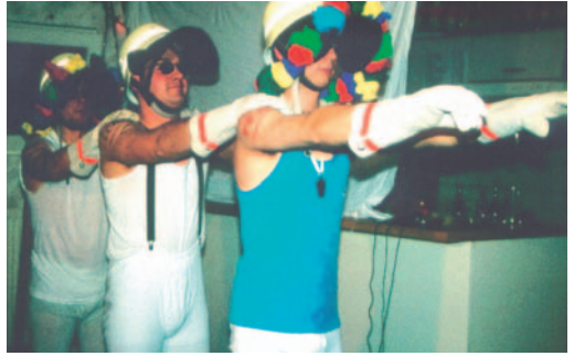
Die Guggenmusik in Aktion

Die Bühnenshow wurde immer aufwändiger z.B. mit dem Zersägen der Eingangstüre, Abseil- und Kletteraktionen, Lightshow und Pyrotechnik. Die Fangemeinde wuchs stetig, die Groopies wurden immer aufdringlicher. Zwischenzeitlich war die Band so berühmt, dass die Fans sogar heimlich in die Proberäume einzudringen versuchten, nur um ihren Idolen nahe zu sein. Mit der Nachwuchsband „Allgäu Trio“ wurden weitere JRKler kreativ tätig. Nach der Devise „Wenn es am schönsten ist, sollte man aufhören“ verabschiedete sich die Guggenmusik Lange Unterhosen mit einer fulminanten Show am 31.12.2000 von ihren treuen Fans.