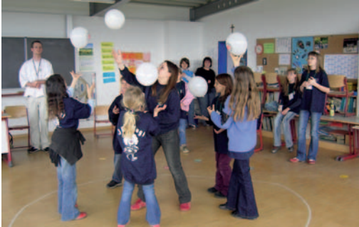
Sport und Spiel- Aufgabe

Natürlich dürfen bei den Jugendrotkreuz-Wettbewerben sportliche und spielerische Aspekte nicht fehlen. Hierbei sind Geschicklichkeit, logisches Denken sowie gezielter Körpereinsatz gefragt. Beim Landesentscheid in Göppingen ging es z.B. darum, in der Fußgängerzone, an einem Seil gesichert, Bierkisten (auf denen man selbst drauf steht) so geschickt und so hoch wie möglich aufeinander zu stapeln. Das JRK Vogt gab sein Bestes, stapelte mit 24 (!) Kisten den höchsten Bierkistenturm und belegte dadurch in diesem Bereich den 1. Platz.