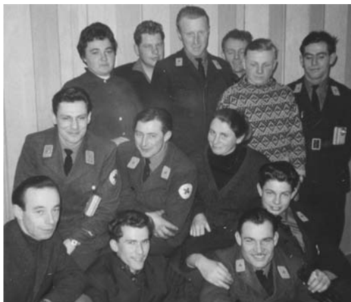
Gruppenbild ca. 1963