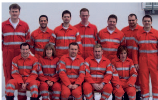
Guppenbild der SEG Vogt 2006

Die Hauptaufgabe der Schnelleinsatzgruppe des DRK Vogt besteht darin, die Zeit zwischen Notruf und dem Eintreffen des Rettungsdienstes mit lebensrettenden und stabilisierenden Maßnahmen zu überbrücken. Nachdem der Rettungsdienst aus Kisslegg, Ravensburg oder Wangen kommt, hat die SEG i.d.R. einige Minuten Vorsprung, die entscheidend sein können. Durchschnittlich fallen ca. 80 Einsätze pro Jahr an.